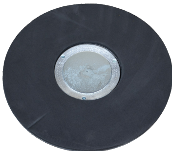
Plateau support abrasif double face