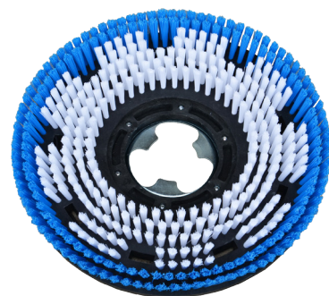
Plateau brosse nylon (souple et dure)